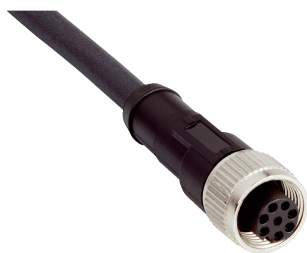
图片可能存在偏差