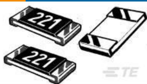
TE 产品编号1-2176070-5 3521 39R 1% 2W