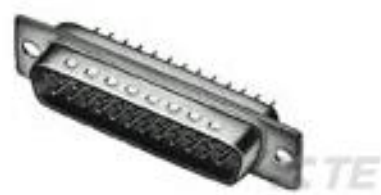
TE 产品编号7-1393740-8 V42254A2216C209=SUB D STIFTLEI