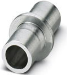
铝制笔架，用于标记绘图仪时固定P-PEN

Please be informed that the data shown in this PDF Document is generated from our Online Catalog. Please find the complete data in the user's documentation. Our General Terms of Use for Downloads are valid ( http://download.phoenixcontact.com )