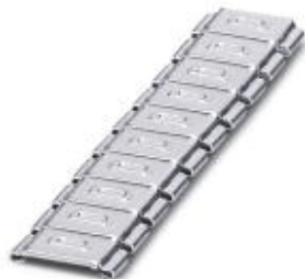
标识套筒，标记带大写字母：字母，银色，宽度: 5.5 mm

Please be informed that the data shown in this PDF Document is generated from our Online Catalog. Please find the complete data in the user's documentation. Our General Terms of Use for Downloads are valid ( http://download.phoenixcontact.com )