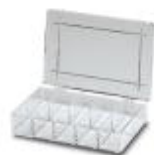
分类箱，尺寸：170 x 105 x 32 mm，10个隔间，隔间尺寸：50 x 32 mm