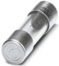
CF 1000剥线和压线机的附件，干线保险丝，20 x 5 mm，慢熔断，2安培，最高至250 V

Please be informed that the data shown in this PDF Document is generated from our Online Catalog. Please find the complete data in the user's documentation. Our General Terms of Use for Downloads are valid ( http://download.phoenixcontact.com )