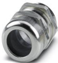
电缆密封，螺钉连接材料: 镀镍铜，电缆外径 18 mm ... 25 mm，屏蔽: 无，连接螺纹: Pg29，颜色: 银色，带O型圈

Please be informed that the data shown in this PDF Document is generated from our Online Catalog. Please find the complete data in the user's documentation. Our General Terms of Use for Downloads are valid ( http://download.phoenixcontact.com )