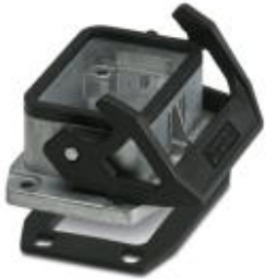
HEAVYCON B6面板安装底座，带单锁扣，带平垫片，耐盐水铝材，可导电异形垫圈。

Please be informed that the data shown in this PDF Document is generated from our Online Catalog. Please find the complete data in the user's documentation. Our General Terms of Use for Downloads are valid ( http://download.phoenixcontact.com )