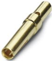
D-SUB压接插针，接线方式: 压接，接线容量: AWG 24- 20

Please be informed that the data shown in this PDF Document is generated from our Online Catalog. Please find the complete data in the user's documentation. Our General Terms of Use for Downloads are valid ( http://download.phoenixcontact.com )