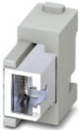
插芯模块, 位数: RJ45, 型号: RJ45, 孔式插头, 50 V, 1 A, 应用: 数据, 转接器

Please be informed that the data shown in this PDF Document is generated from our Online Catalog. Please find the complete data in the user's documentation. Our General Terms of Use for Downloads are valid ( http://download.phoenixcontact.com )