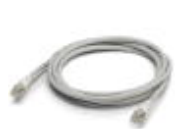
尾缆, CAT6, 预制, 0.3 m