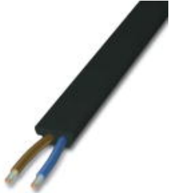
AS-I黑色EPDM扁平电缆，用于附加电源，2 x 1.5 mm 2 ，每卷100 m

Please be informed that the data shown in this PDF Document is generated from our Online Catalog. Please find the complete data in the user's documentation. Our General Terms of Use for Downloads are valid ( http://download.phoenixcontact.com )